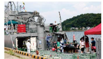
海上自衛隊艦艇の一般公開