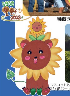
マスコット名「ひまじー」