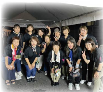
女性部小川支部の皆さん

また、女性部だけではなく通りにある事業所さんも出店されており、焼き鳥やヨーヨー釣りなど様々な商品があり、どのお店も行列が出来る程でした。