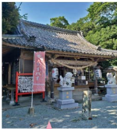
永尾剣神社に設置したエイパイの「のぼり」