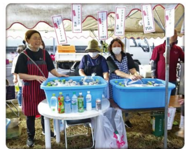
女性部で飲み物を販売

き鳥、焼きそば、飲み物等を頑張って販売しましたがどれも大盛況で、多くの来場者に喜んでいただきました。(川本)