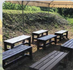
休憩所(中学生作成の椅子)