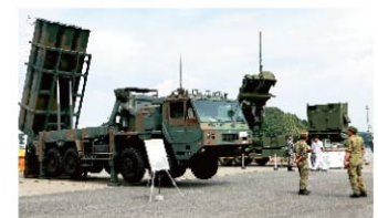
陸上自衛隊装備品の展示