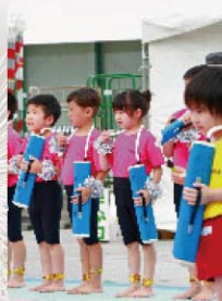
幼稚園児による演奏