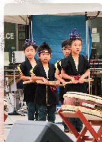
小学生による和太鼓演奏

近年はコロナの影響で開催中止や、縮小開催が続いていたため久しぶりの通常開催となりました。地元の子供たちや婦人会によるステージイベントが披露されたほか、自衛隊による装備品の展示や、海上保安部の体験航海などが実施されました。