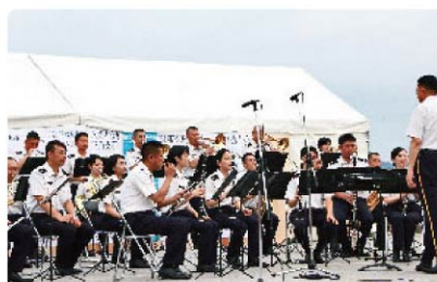
陸上自衛隊第8音楽隊による演奏

近年はコロナの影響で開催中止や、縮小開催が続いていたため久しぶりの通常開催となりました。地元の子供たちや婦人会によるステージイベントが披露されたほか、自衛隊による装備品の展示や、海上保安部の体験航海などが実施されました。