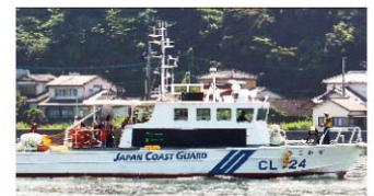
海上保安部巡視船「ひごかせ」による体験航海