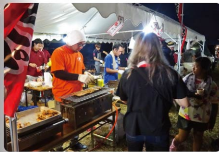
青年部の焼鳥、焼きそばのコーナーには長蛇の列

き鳥、焼きそば、飲み物等を頑張って販売しましたがどれも大盛況で、多くの来場者に喜んでいただきました。(川本)