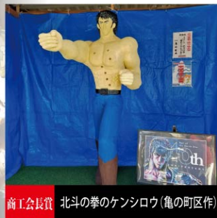
商工会長賞 北斗の拳のケンシロウ(亀の町区作)

昨年とは違い、好天に恵まれ最高のお祭り日和となりました。新型コロナウイルススは何処吹く風で、会場にはひと、ヒト、人。多くの来場者が訪れていました。各地で行われておりますお祭りも例年に無い最高の客入りとよく耳にします。会場内にある女性部小川支部バザーテントでは、ソフトドリンクや袋詰めお菓子を販売されており、今年はラムネが飛ぶように売られていました。