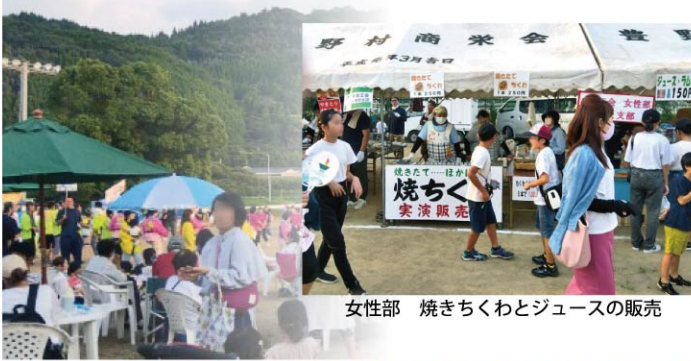
女性部 焼きちくわとジュースの販売

また、お楽しみ抽選会においては、豊野町内の多くの商工会会員事業者にご協力頂いたおかげで、豪華賞品が当たった方々から歓喜の声が上がるなど会場内は大盛り上がりとなりました。