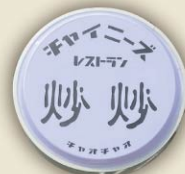
この看板が目印です