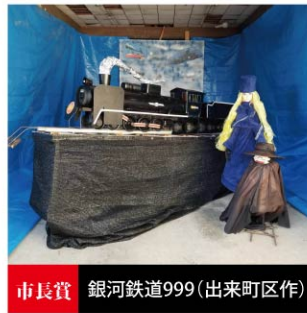
市長賞 銀河鉄道999(出来町区作)

本題の造り物大会では、11基の造り物が小川商店街通りに展示され、北斗の拳のケンシロウ(亀の町区作)が商工会長賞、銀河鉄道999(出来町区作)が市長賞を受賞されました。どれも躍動感のある作品で、会場を訪れたお客さんは観賞されていました。(久保田)