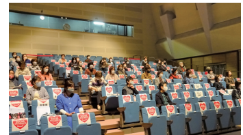
会場には自粛席(ソーシャルディスタンス)を多数設けて開催しました