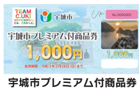
宇城市プレミアム付商品券