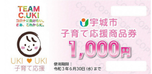
宇城市子育て応援商品券

換金請求期限:令和3年3月3日(水)まで 商品券の使用期限は、令和3年2月28日(日)