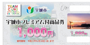
第2弾 宇城市プレミアム付商品券